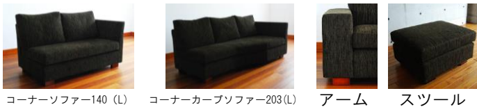
コーナーソファ140 (L) コーナーカーブソファ203(L) アーム スツール